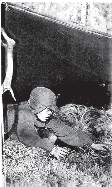
RAMP gir også rom for tid alene og introspektiv aktivitet