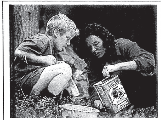
Samarbeid skaper vennskap